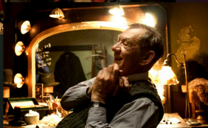
Костюмер (2015 г.)