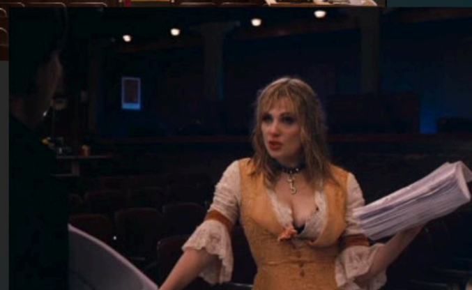
Венера в мехах (2013 г.)