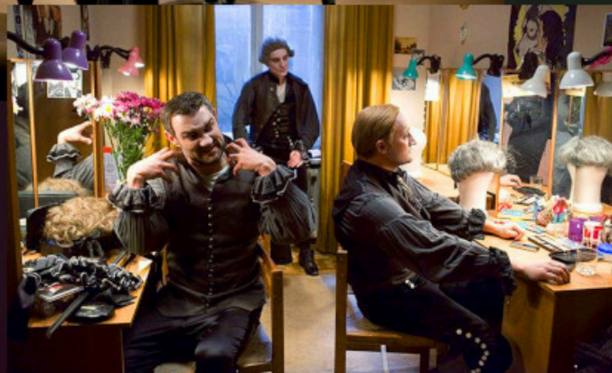
Упражнения в прекрасном (2011 г.)