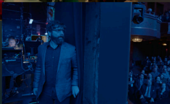
Бёрдмэн (2014 г.)